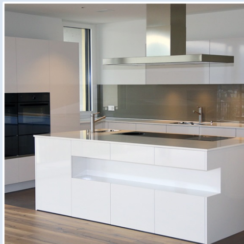
Glasrückwand, Untermattstrasse in Horw

Von der Beratung und Planung bis hin zur Realisierung - Twerenbold AG – Ihr Partner für Glastechnik und Metallbau von A bis Z!